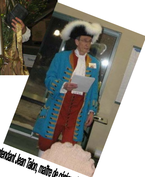
L'intendant Jean Talon, maître de cérémonie